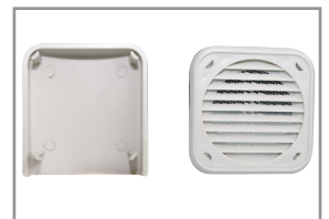
DS-VH-60/DS-VH-80 (75×75mm) (100×100mm)